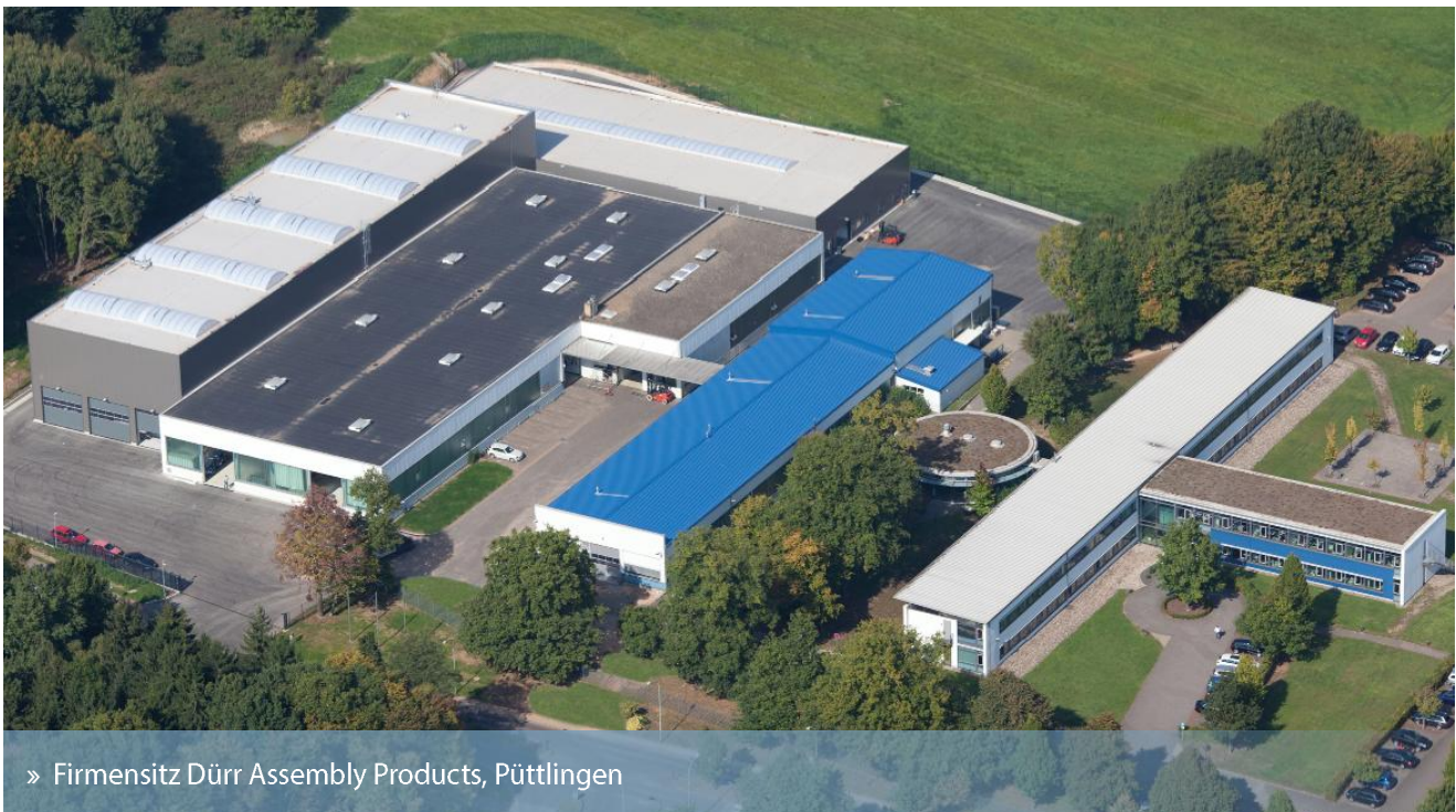
» Firmensitz Dürr Assembly Products, Püttlingen