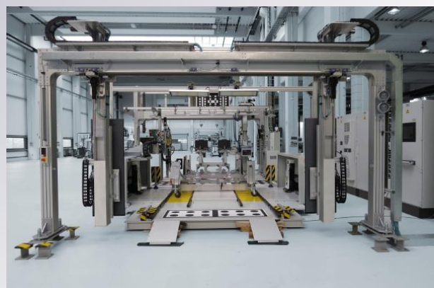
» Prüfstand Fahrerassistenzsysteme x-DASalign