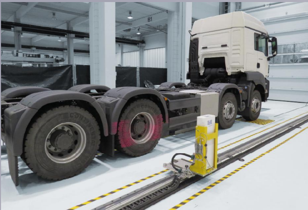
» Fahrwerkstand x-wheel truck d

Wir prüfen unter anderem die Einzel- und Gesamtpurwinkel, die Sturz- und Nachlaufwinkel, die Einstellqualität von Scheinwerfern und Fahrerassistenzsystemen, Fahr- und Bremsverhalten sowie die Fahrzeugelektronik.