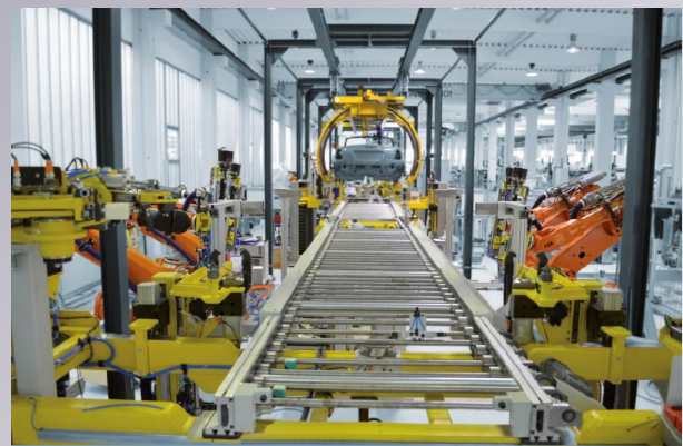
» Aggregatmontage „Hochzeit“

Das beginnt mit der Vormontage anspruchsvoller Baugruppen wie z. B. Vorder- oder Hinterachsen oder Motoren und reicht bis zum komplexesten und schwierigsten Montageschritt, der sogenannten „Hochzeit“. Dabei werden der gesamte Antriebsstrang, das Fahrwerk und die Karosserie präzise gefügt und miteinander verschraubt.